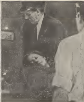
Riba e promer grafico ta apara Christine Keeler (drecht) y Marilyn "Mandy" Rice-Davies, despues di a sali di e tribunal Old Bailey. Riba e otro grafico nos por mira e momento cu Dr. Ward mester a wordo traslada pa hospital, despues cu a wordo informa cu el a tuma pildoran pa cometé suicidio.